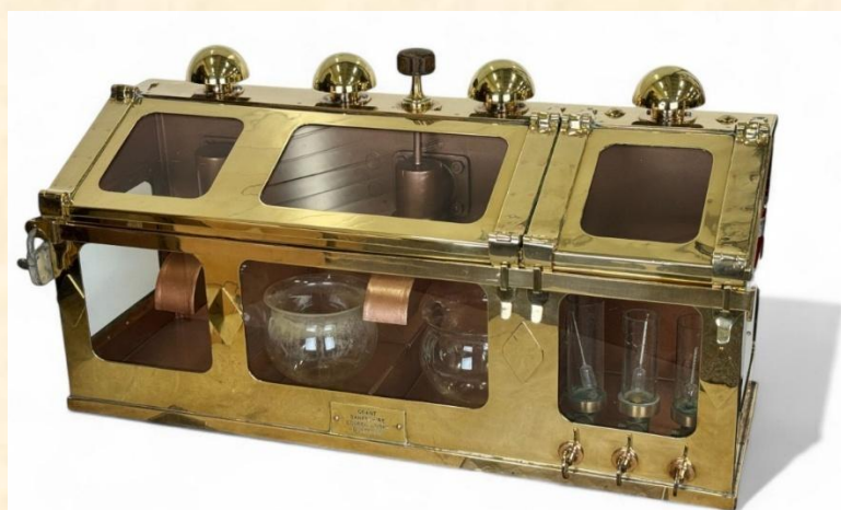
Kétszeres lepárlásnál alkalmazott spirit safe fotója